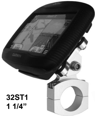
32ST1 1 1/4"